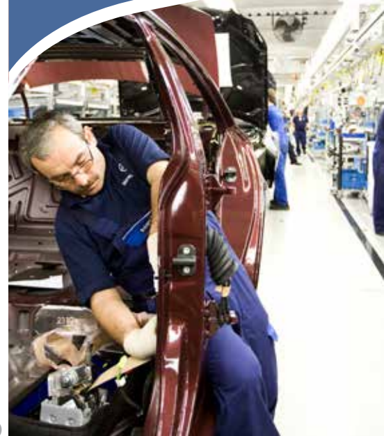
FOTOS 5 Y 6: Planta de Mercedes-Benz, en Sindelfingen, Alemania.