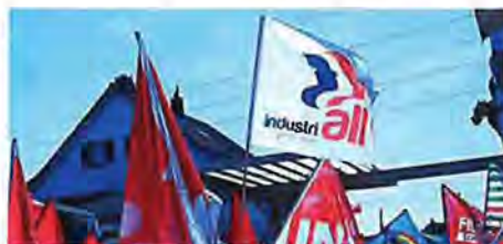
ФОТО 4 Флаг IndustriALL на демонстрации против компании Holcim в Дюбендорфе (Швейцария). IndustriALL