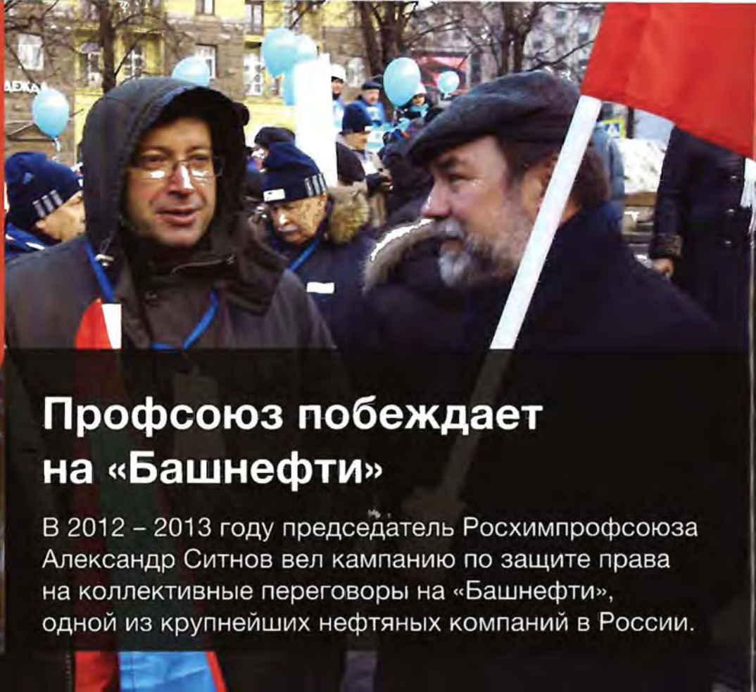
ФОТО: Председатель Росхимпрофсоюза Александр Ситнов на митинге.